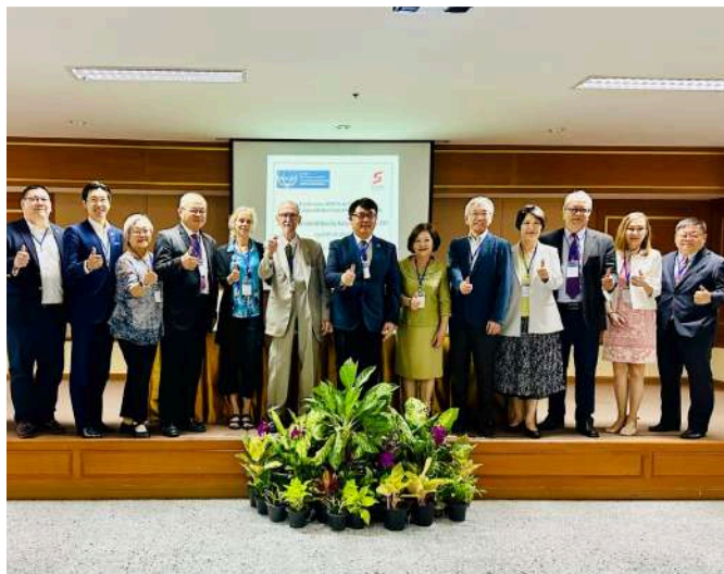
STUF自2023年起成為CoNGO亞太區域委員會(RCAP)成員，2024年4月參加泰國曼谷的RCAP會議。